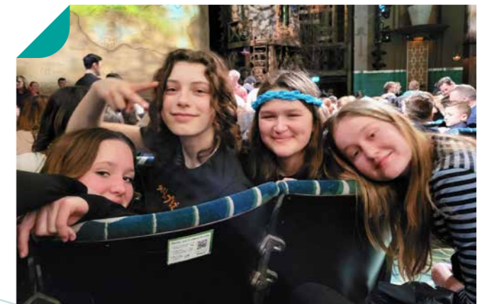
Met de Engelandreis naar the Musical Wicked